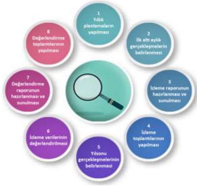
Şekil-4 İzleme ve Değerlendirme Süreci

İzleme ve değerlendirme sürecinin işleyişi ana hatları ile yukarıdaki şekilde özetlenmiştir.